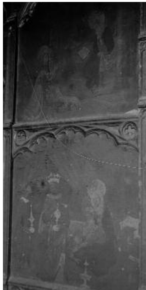
Fig. 8 Detalle del Retablo de la Virgen , iglesia parroquial de Puertomingalvo