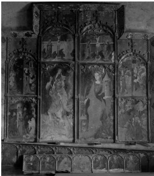
Fig. 7 Conjunto facticio con las piezas del Retablo de santa Bárbara , la tabla central del Retablo de sant Cristóbal y la predela del Retablo de la Virgen , iglesia parroquial de Puertomingalvo