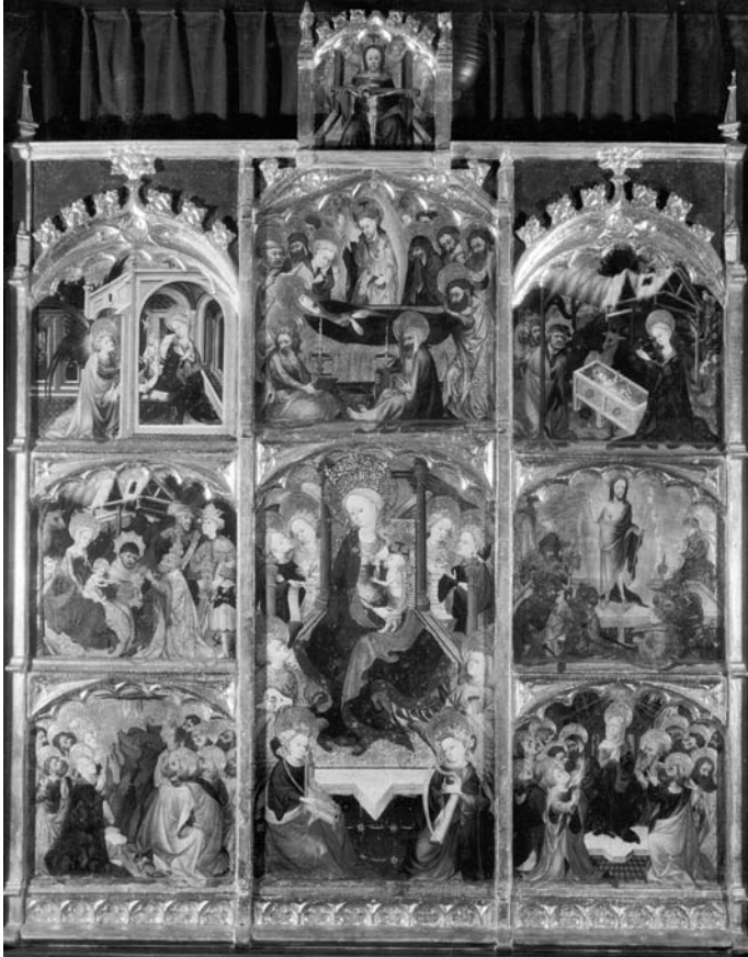
Fig. 10 Gonçal Peris, Retablo de la Virgen . Antigua col·lecció Muñoz, Barcelona (anteriormente colección Bosch Catarineu, Barcelona). En paradero desconocido