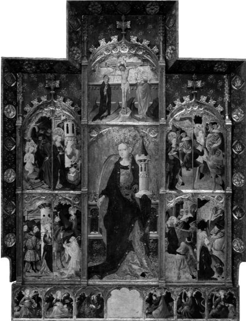
Fig. 6 Gonçal Peris, Retablo de santa Bárbara , procedente de Puertomingalvo