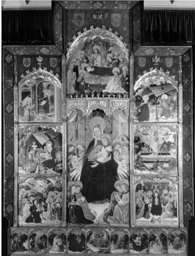
Fig. 9 Círculo o taller de Gonçal Peris, Retablo de la Virgen , procedente de Puertomingalvo, Kansas City, Nelson Atkins-Museum of Art