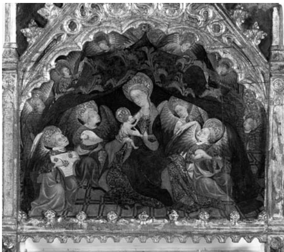
Fig. 5 Gonçal Peris, Virgen de la Leche con ángeles músicos